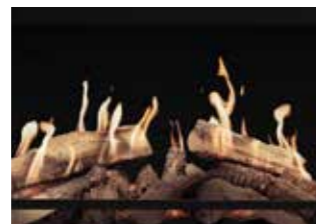
Technologia Dual HD Flame