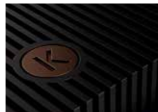
Design płyta dolna