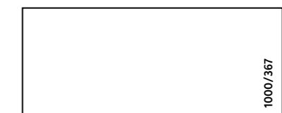
Kalfire E-one 100F