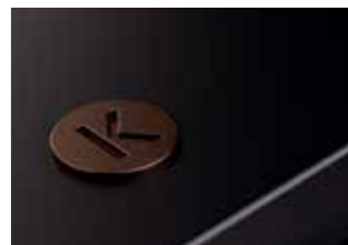
Płaska płyta dolna