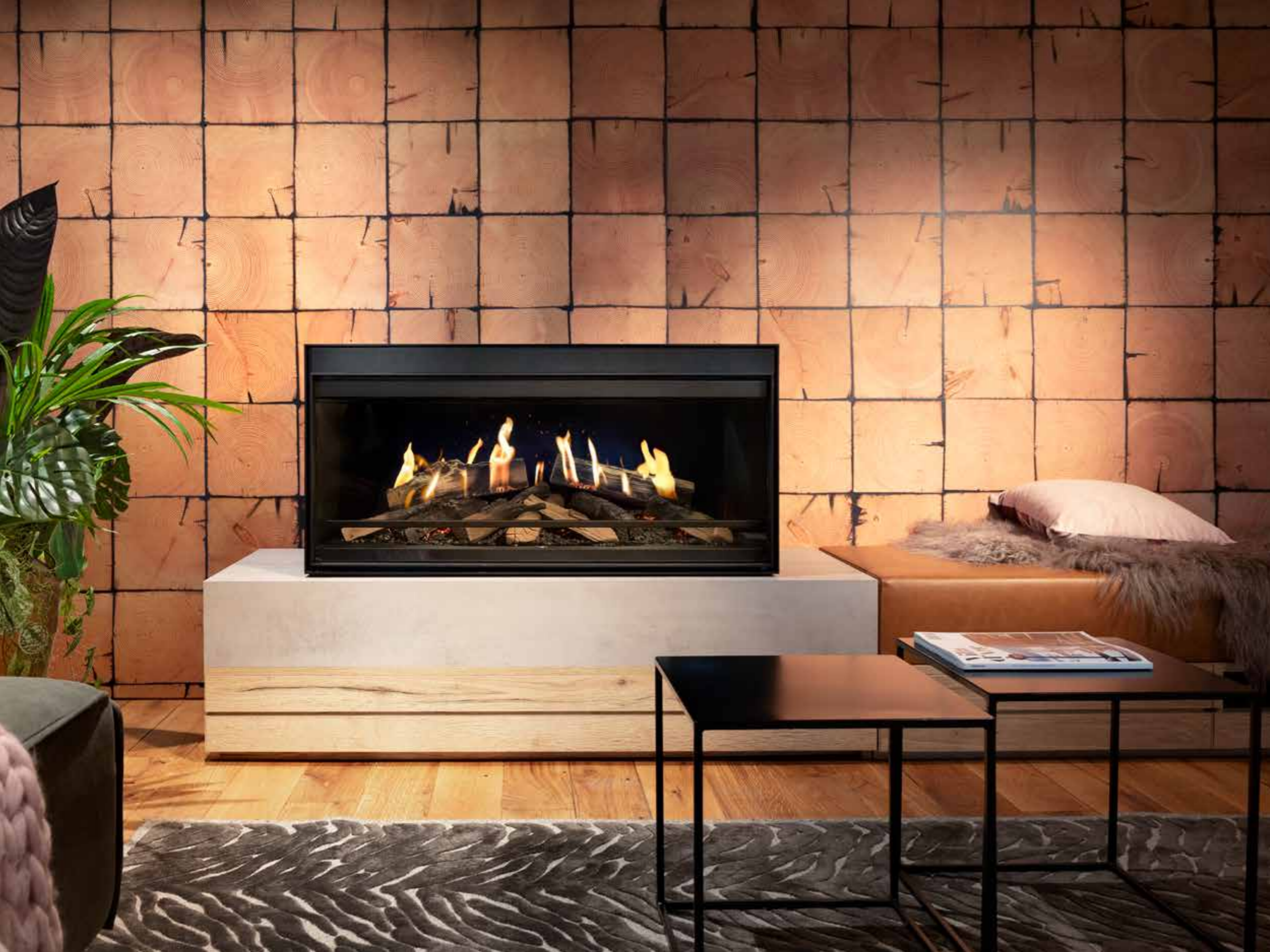
Kalfire E-one 100F FR