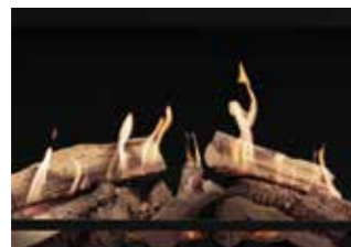
Technologia Single HD Flame